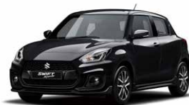
Super Black Pearl Metallic (ZMV)