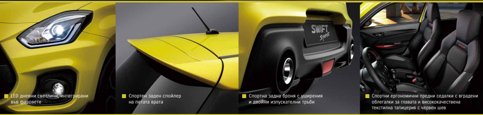
LED дневни светлини, интегрирани във фаровете