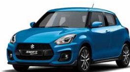
Speedy Blue Metallic (ZWG)