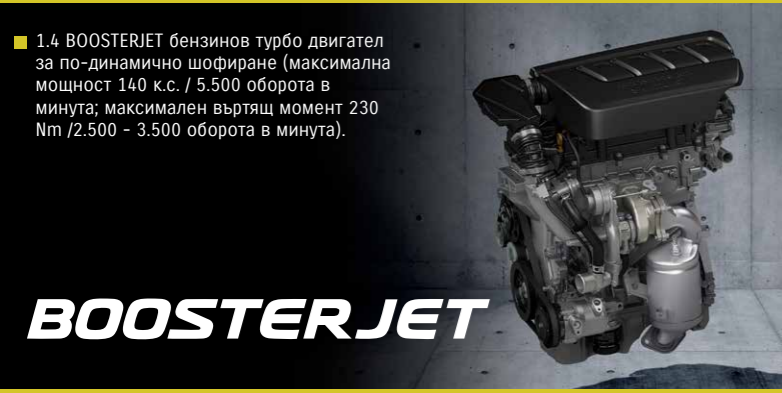
1.4 BOOSTERJET бензинов турбо двигател за по-динамично шофиране (максимална мощност 140 к.с. / 5.500 оборота в минута; максимален въртящ момент 230 Nm / 2.500 - 3.500 оборота в минута).