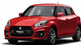
Burning Red Pearl Metallic (ZWP)