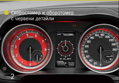
Скоростномер и оборотномер с червени детайли