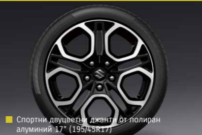
Спортни двувъздушни джанти от полиран алуминий 17" (195/45R17)