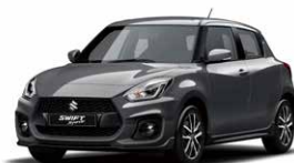
Mineral Gray Metallic (ZMW)