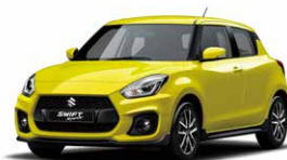
Champion Yellow Metallic (ZFT)