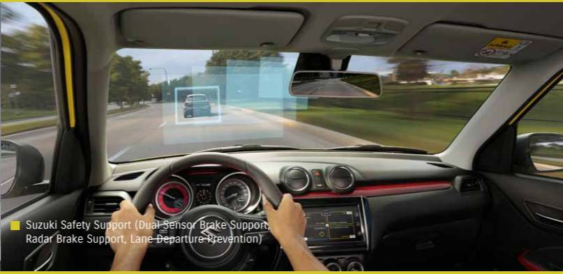
Suzuki Safety Support (Dual Sensor Brake Support, Radar Brake Support, Lane Departure Prevention)