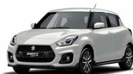
Pure White Pearl Metallic (ZVR)