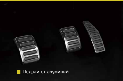
Педали от алуминий